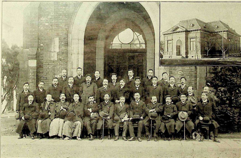
員會列參會大回一第會學策政會社