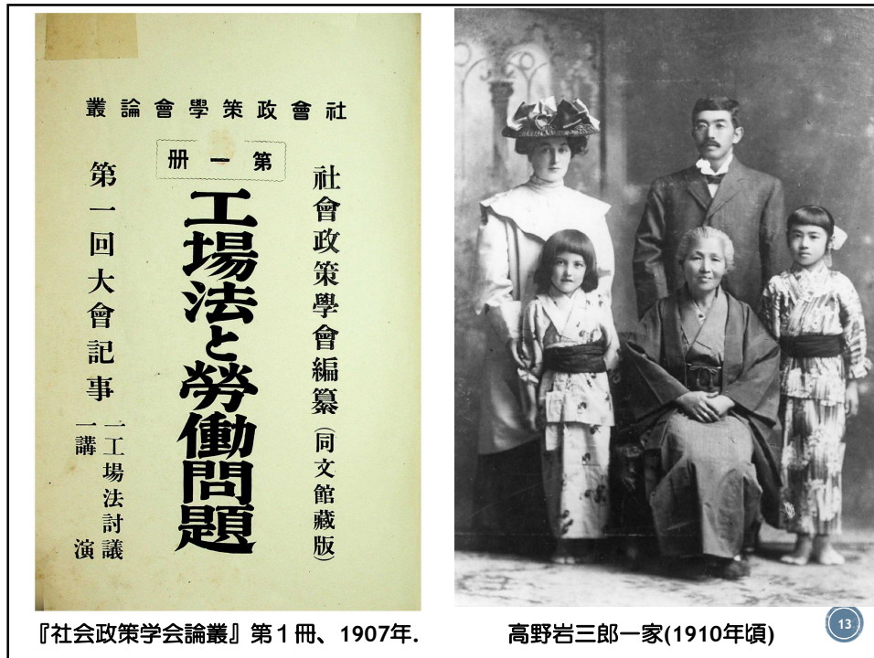
『社会政策学会論叢』第1冊、1907年。